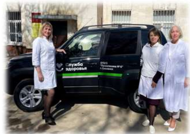
Медицинские организации оснастили современным санитарным транспортом