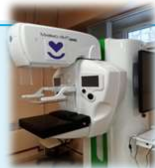
Новое медицинское современное оборудование