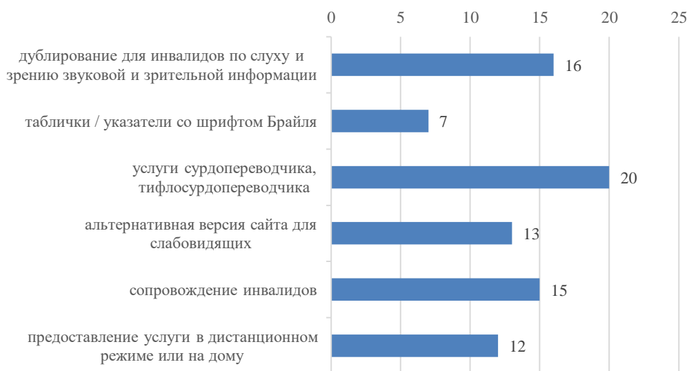
График 4. Отсутствие параметров оценки доступности медицинских услуг для инвалидов, количество организаций