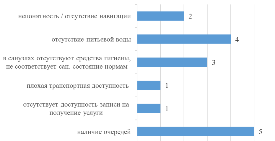
График 2. Выявленные недостатки условий комфортности в медицинских организациях, количество организаций

Из 7 обязательных и 2 дополнительных условий комфортности предоставления услуг в организации должны присутствовать 5 для того, чтобы оценка была в 100,0 баллов. У всех организаций присутствуют 5 и более условий комфортности. Несмотря на это, у организаций выявлены недостатки по оцениваемым параметрам, о них более подробно изложено в соответствующем разделе отчета. Чаще всего отмечается наличие очередей (5 организаций) и отсутствие питьевой воды (4 организации).