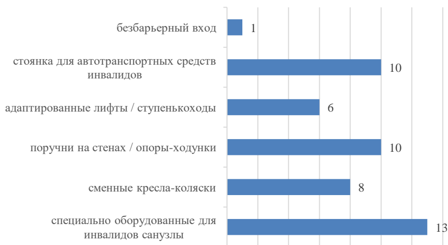
График 3. Отсутствие условий доступности для инвалидов в медицинских организациях, количество организаций

Оборудование территории, прилегающей к организации здравоохранения, и ее помещений с учетом доступности для инвалидов, в целом, находится на среднем уровне. Из 20 оцениваемых организаций 2 набрали 100,0 баллов, 5 организаций набрали 80,0 баллов, 4 организации набрали 60,0 баллов, 5 организаций – 40,0 баллов и 4 организации набрали 20,0 баллов. Чаще всего отсутствуют специально оборудованные санитарные комнаты (санузлы) для инвалидов (13 организаций), поручни на стенах и стоянка для автотранспорта инвалидов (10 организаций).